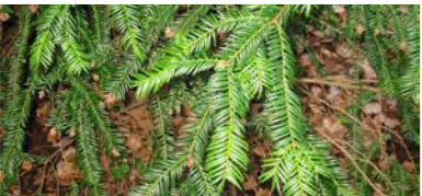
El teix, present al barranc del Titllar

Els bosquets de teixos es troben puntualment en alguns fondals ombrívols de l'obaga del barranc del Titllar. El seu interès radica en el fet que la teixeda és una de les comunitats vegetals de caràcter més netament eurosiberià i que actualment es troba en regressió i gairebé en perill d'extinció. Per aquest motiu, actualment el teix ( Taxus baccata ) és una espècie que està protegida per llei i la seva recol·lecció n'és prohibida.