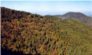
Comunitat de roure reboll, als voltants del Tossal de la Baltasana

La comunitat de roure reboll, present als voltants del Tossal de la Baltasana per damunt dels 950 m i sempre sobre substrat silícic , atorga un especial interès a aquest indret per ésser l'única existent a Catalunya. Actualment la presència del roure reboll ( Quercus pyrenaica ) es deu a la seva capacitat de rebrotar, tot i que, a causa de l'explotació intensa que va sofrir antigament, sovint es troba barrejat amb el pi roig ( Pinus sylvestris ), d'edat ja molt avançada. Aquesta comunitat presenta també un gran interès paisatgístic, donat pel contrast de color verd de les fulles de les alzines i dels pins, amb el marró de les fulles seques del roure reboll, les quals romanen permanents a l'arbre durant tot l'hivern i fins poc abans de tornar a rebrotar.