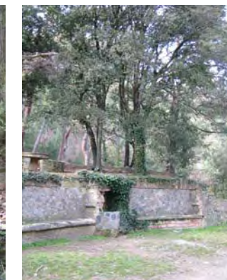
Font de la Casa Forestal del Titllar