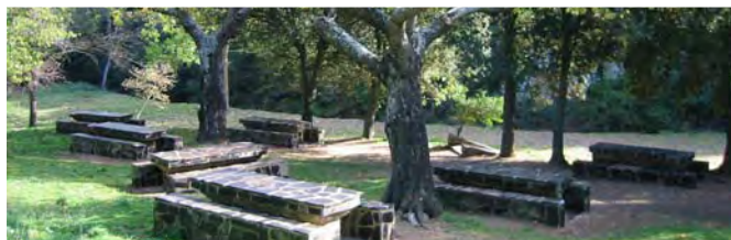
Àrea de lleure de la font de la Teula

En aquest punt s'inicia el descens pel senderó fins arribar al Coll del Bosc, des d'on s'arriba novament a la casa forestal, a través d'un sender que s'endinsa per la roureda de roure reboll i la teixeda. A partir d'aquí, comença el descens fins al punt de partida seguint el mateix recorregut realitzat ja de pujada.