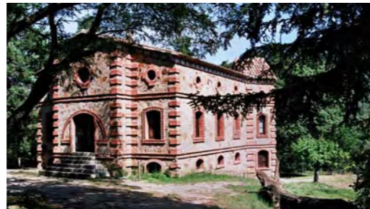
Casa Forestal del Titllar

Posteriorment, a partir de la dècada dels seixanta , es va restaurar la casa forestal i es va reactivar el planter per tal d'obtenir plançons pels treballs de replantació realitzats al bosc de Poblet i a altres forests públiques properes. Les últimes millores realitzades daten de l'any 1974 .